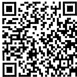
Muat Turun Borang JANM(K) 1/2008